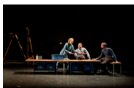
Mort d'une montagne