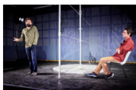
Une ombre vorace