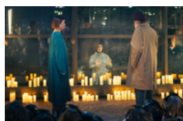
La Fin du présent